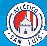
Atlético San Luis